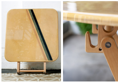
Bag and clothes hook. Gancho para bolso y ropa. Crochet à vêtements et sac.

(EN) Wood's care The wood used is glued weather-resistant birch plywood in accordance with standard EN 314-2/ type 3 for outdoor use. An outdoor protection water-based varnish has been applied which protects the colour of the wood for a longer period as it contains solar filters and iron oxides that give the wood considerable protection from ultraviolet rays. To keep the colour unaltered